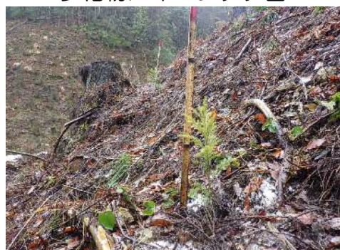
少花粉スギコンテナ苗