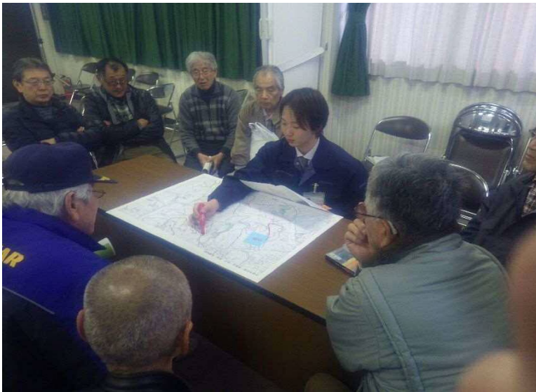
R1 那谷・栗津地区事業推進会