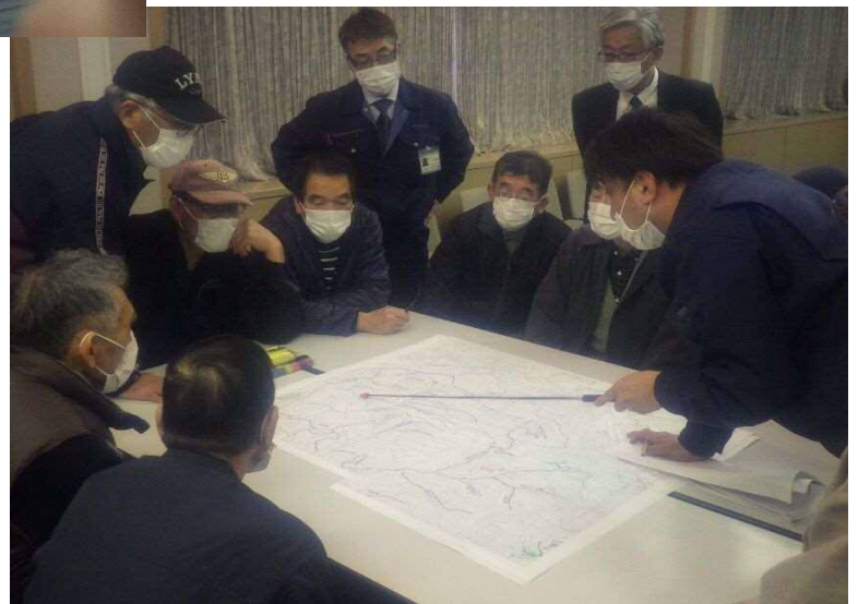
R1 辰口地区事業推進会