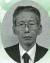
石川県南加賀農林総合事務所