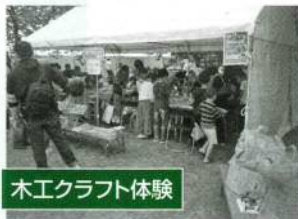
木工クラフト体験