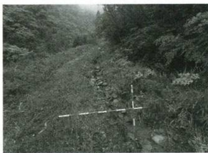
▲大雨による林道洗掘状況の調査