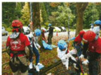
ツリークライミング