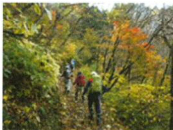
トレッキングツアー

年間のイベントは10回予定しており、周辺の原生林を探訪するトレッキングツアーや子供用のツリークライミング、親子グランドゴルフ、魚つかみ、しいたけ菌打ち等々、さまざまな年齢層が楽しめる内容となっています。是非一度参加してみたいかたがですか。国道8号線加賀市松山町交差点から県道153号線今立町を經由し、林道立杉線の杉水側にあります。所要時間は前記交差点から約30分程です。