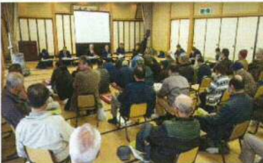
（南加賀農林総合事務所森林部）

アンケートは、昨年12月の金剛寺地区から3月の白山市の地区座談会まで計12回行い、684人（南加賀管内549人、石川管内135人）という多くの方々からの回答をいただきました。