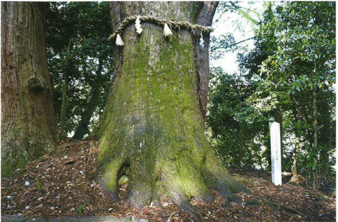
巨木シリーズ：白山比咩神社 老スギ