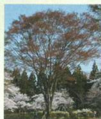
ケヤキ(えびすケヤキ)