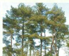
アカマツ(抵抗性アカマツ)