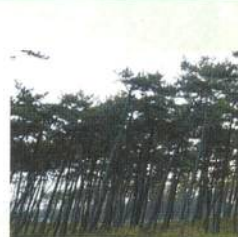
クロマツ(抵抗性クロマツ)