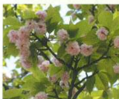
ケンロクエンキクザクラ