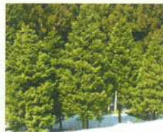
アテ(ヒノキアスナロ)