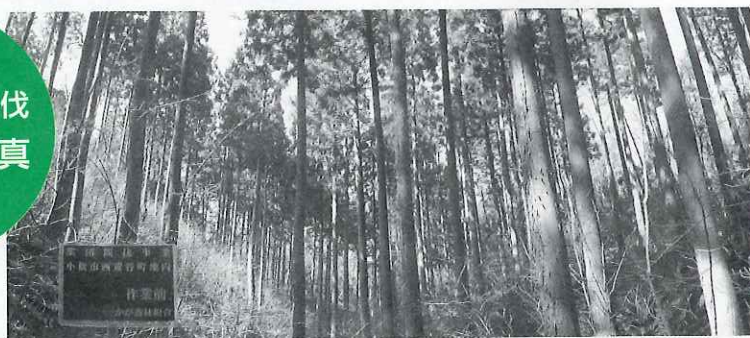
2回目集団間伐 [作業前]