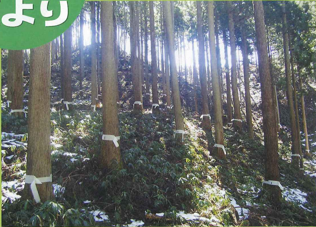
クマ被害防除ベルト実施状況