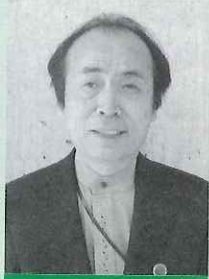
小松市金野町 金野町林産組合様