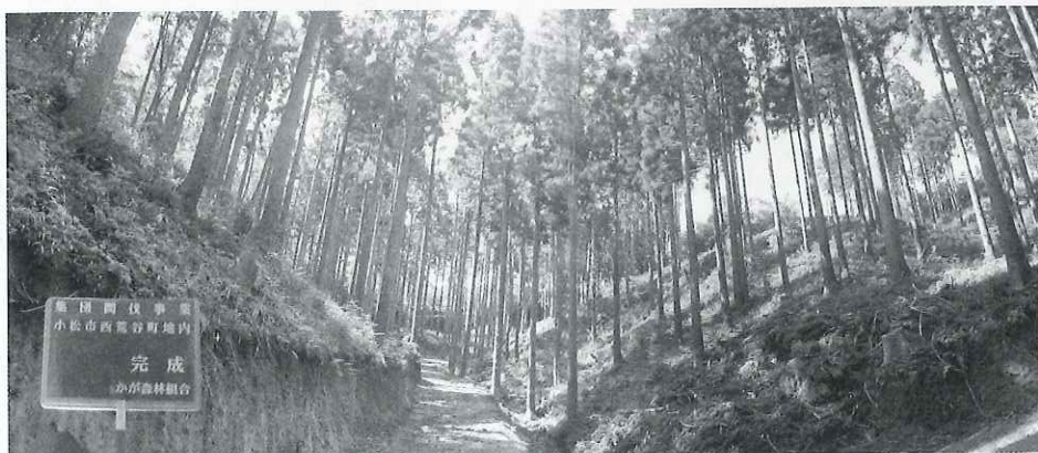
2回目集団間伐 [完成]