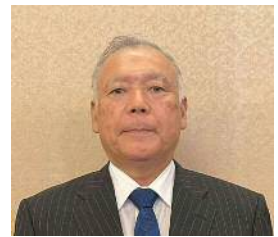
林業功労者 石川県山林協会長表彰 岩本町林産組合 様 (能美市)