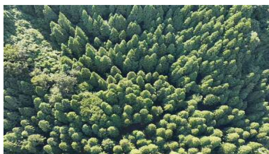
※皆伐・再造林事業の作業前の様子