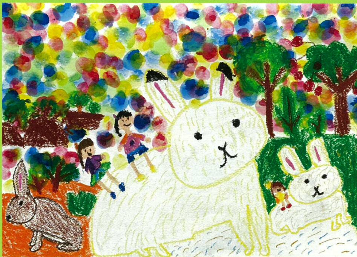
「うさぎにのったよ」